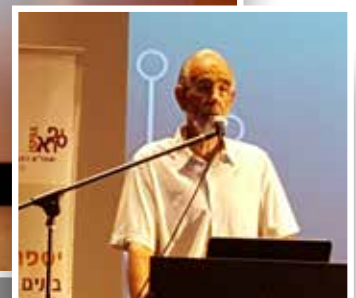
פרופסור יורם בילו